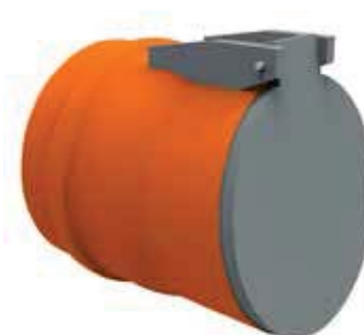
Valvola Clapet Femmina